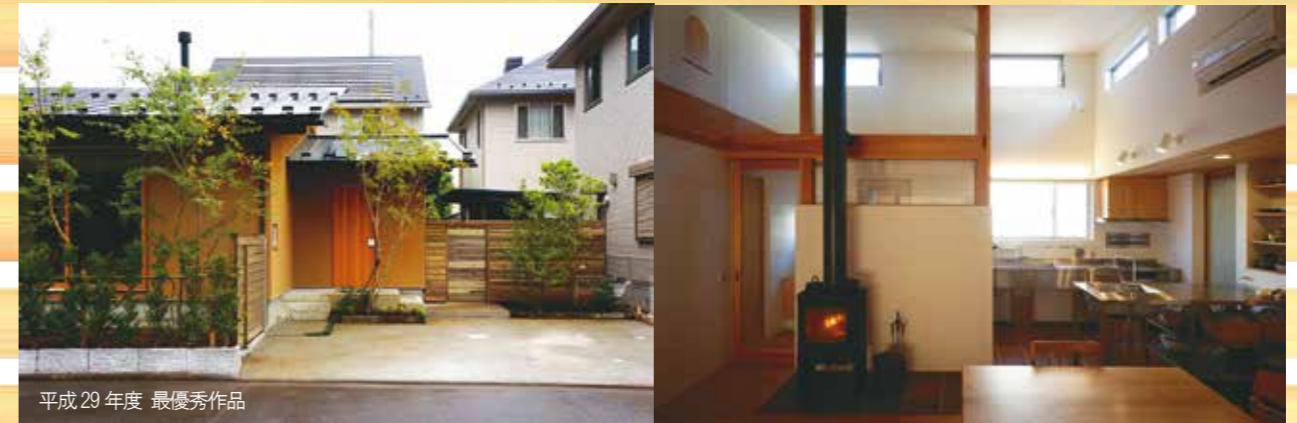
平成29年度 最優秀作品