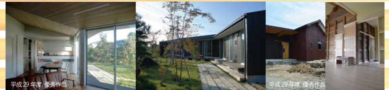
平成29年度 優秀作品